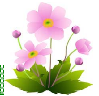
秋明菊（シュウメイギク）